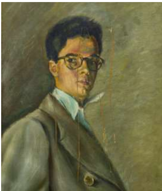
Autorretrato 1953 Fundación Pérez Piñero