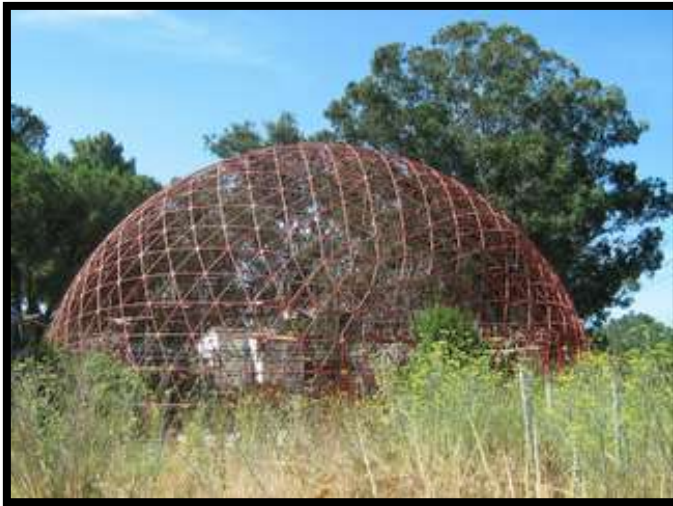
CUPULA DEL IES PEREZ PIÑERO (antes estaba en la discoteca DONE)